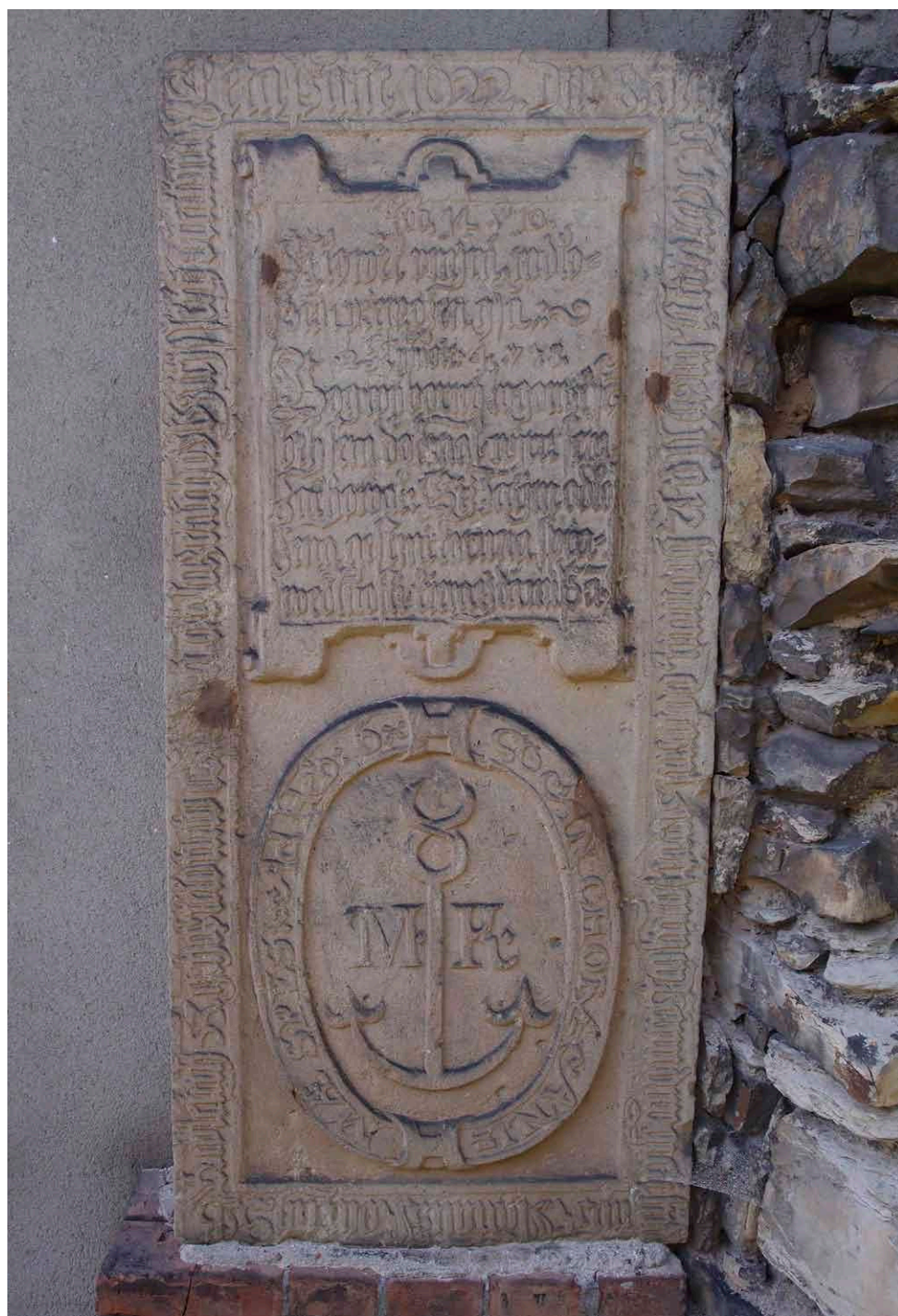
Obr. 2: Náhrobní kámen Matouška Konečného v Brandýse nad Orlicí.