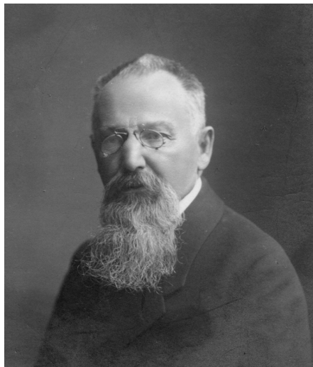
Obr. 1: Markus Oesterreicher (1814–1897) – zakladatel a první starosta pardubické ŽNO