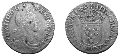
Obr. 1: Francie, Ludvík XIV., 1/12 ecu (5-sou) 1662

ně stanovena platební síla mnohem vyšší. Bez ohledu na skutečný obsah stříbra byl přijímán jako ekvivalent \frac{1}{8} dovážených koloniálních osmirealů, tj. ve francouzské měně 7\frac{1}{2} sou. Proto se pro tyto mince ujalo turecké označení „osminka“; v samotné turecké měně platily 10–11 akçe. 8 Obchod se dlouhodobě vyplácel jak tureckým úředníkům, tak francouzským dopravcům, pokud se obě strany dokázaly o zisk, generovaný výrazným rozdílem kupní síly (mince byla v tureckém peněžním oběhu nadceněna o 50 %), rozumně podělit.