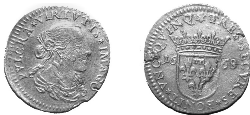
Obr. 4: Itálie, anonymní ražba (zřejmě město Lucca), luigino, 1668

latinské opisy (viz obr. 4). Podstatná část „luiginů“ z druhé poloviny šedesátých let 17. století pak byla ražena ze stříbra podstatně nižší kvality, což byl (vedle výše zmíněného rozdílu v platební síle) další zdroj příjmů jejich vydavatelů.