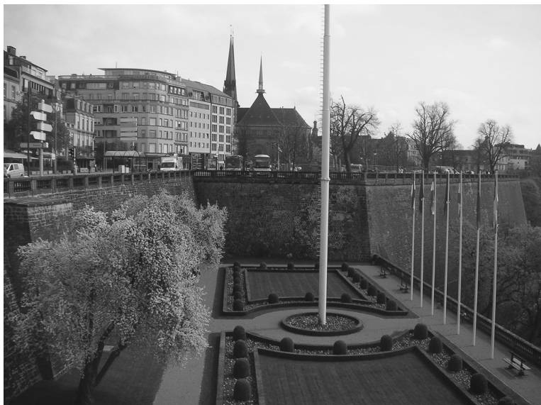
Obr. 11: Bastion Beck v Lucemburku