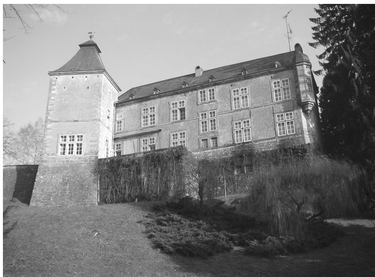
Obr. 3: Beckův nový zámek v Beaufortu