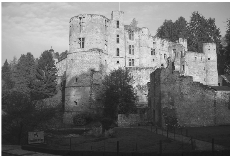
Obr. 5: Hrad Beaufort