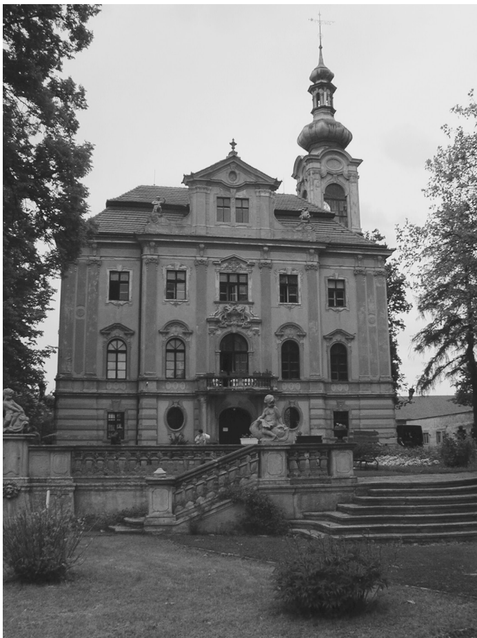
Obr. 10: Zámek ve Vidimi