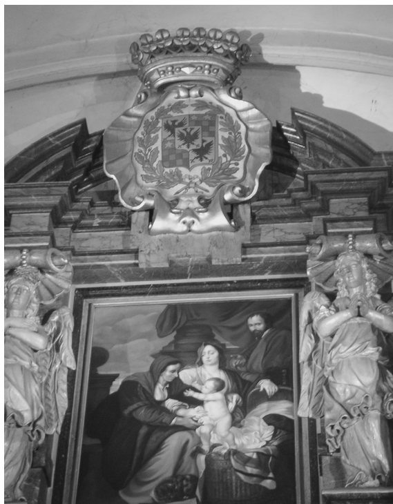
Obr. 8: Horní část itzigského oltáře s Beckovým znakem a obrazem Svaté rodiny