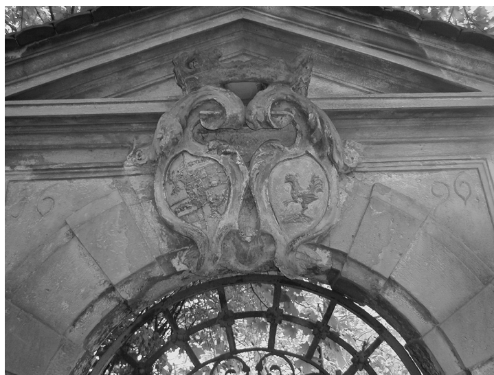
Obr. 9: Znaky Becků a Straků z Nedabylic na portále z roku 1696 v zahradě vidimského zámku