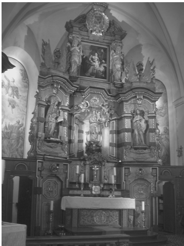
Obr. 6: Beckovský oltář v Itzigu