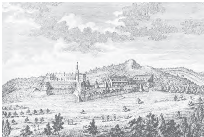
Obr. 2: Hrad Červený Kameň okolo roku 1735.