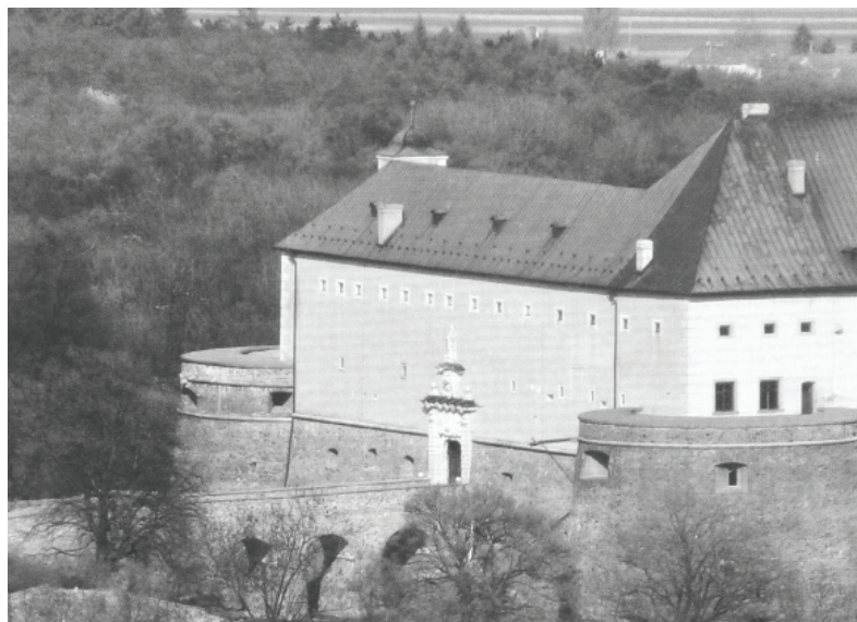
Obr. 1: Hrad Červený Kameň v súčasnosti.