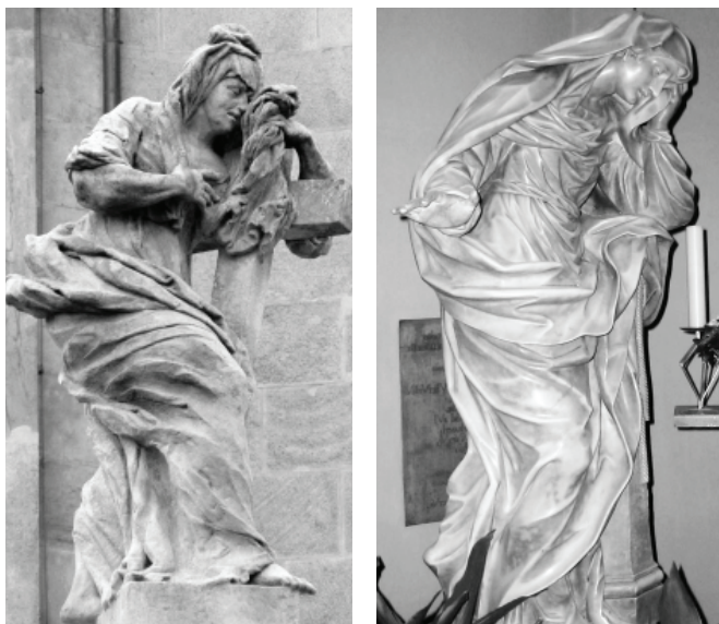
Obr. 3: Matyáš Bernard Braun, Blahoslavení plačící , 1712–1713, Kuks, terasa před špitálním kostelem Nejsvětější Trojice v Kuksu.