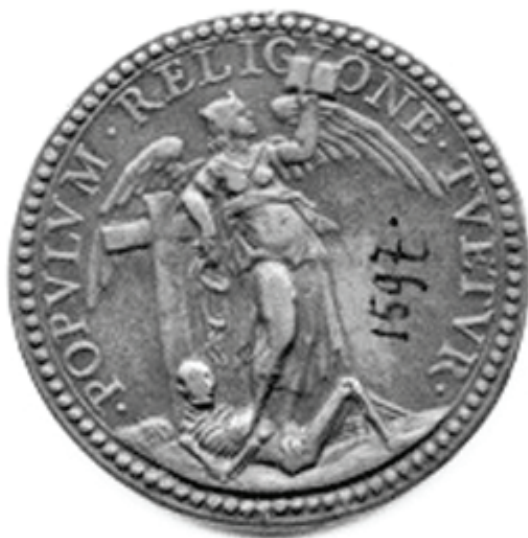
Obr. 8: Alberto Hamerani, Populum religione tuetur, 1657, Řím.