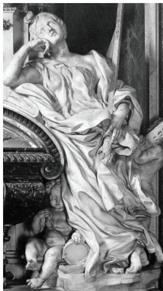
Obr. 13: Matyáš Bernard Braun, Lenost, 1718–1720, Kuks, lapidárium.