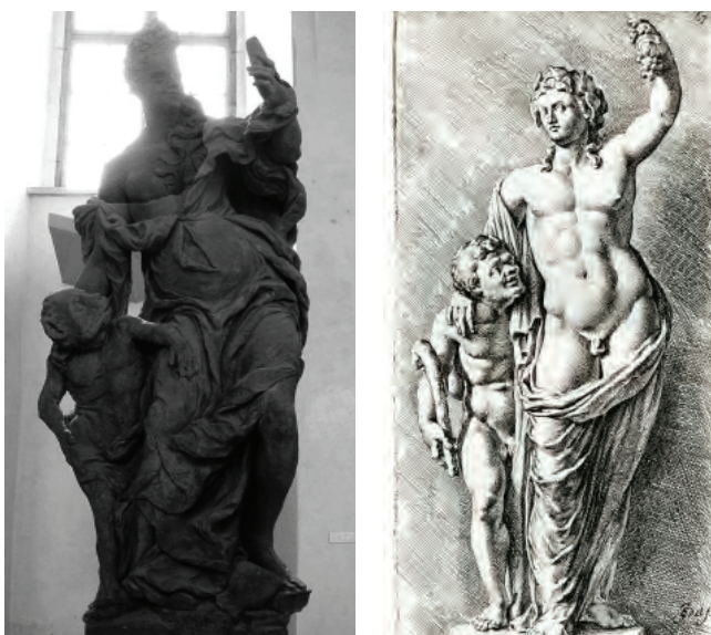
Obr. 11: Matyáš Bernard Braun, Smilstvo, 1718-1720, Kuks, lapidárium.