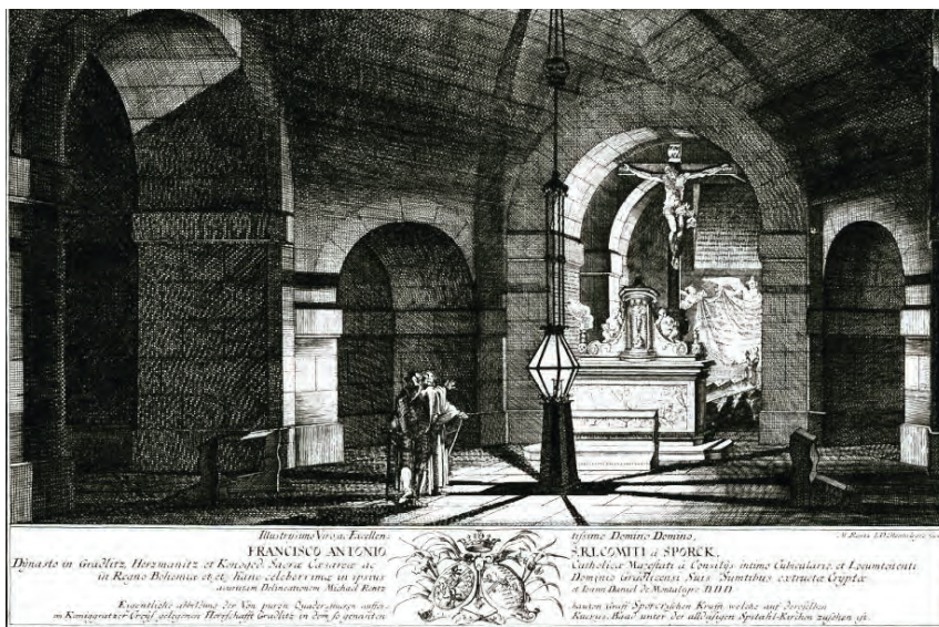
Obr. 1: Michael Jindřich Rentz, krypta špitálního kostela Nejsvětější Trojice v Kuku, 1725, Foto: Jiří Šerých, Michael Rentz fecit. Michael Jindřich Rentz, dvorní rytec hraběte Šporka, Praha 2007.