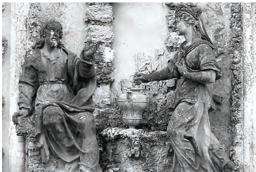
Obr. 18: Gioacchino Fortini, Kristus a Samaritánka, 1724–1727, Florencie – Castello, Villa La Quiete, zahrada.