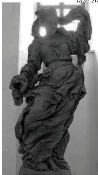
Obr. 14: Gian Lorenzo Bernini, Spravedlnost , 1644–1646, Řím, chrám sv. Petra, náhrobek Urbana VIII. Barberini.