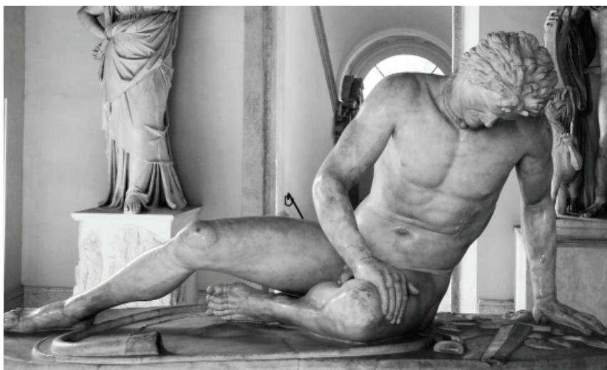
Obr. 20: Římská kopie helénistického originálu z let 230–220 př. Kr., Umírající Gal (stranově převráceno), Řím, Kapitolská muzea.