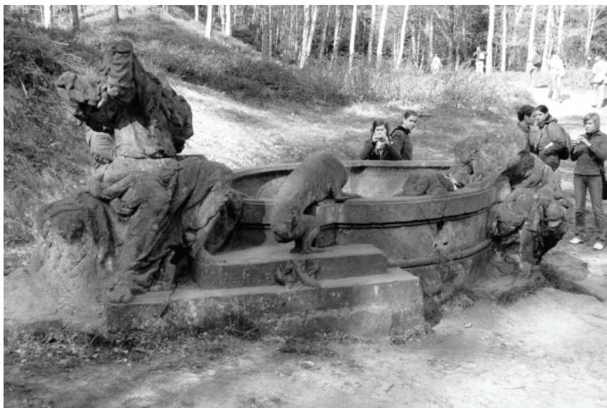
Obr. 17: Matyáš Bernard Braun, Kristus a Samaritánka, 1727–1729, Nový les u Kuksu. Foto: Martin Pavlíček.