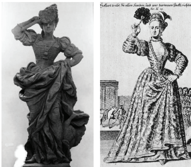
Obr. 9: Matyáš Bernard Braun, Pýcha, 1718–1720, Kuks, lapidárium.