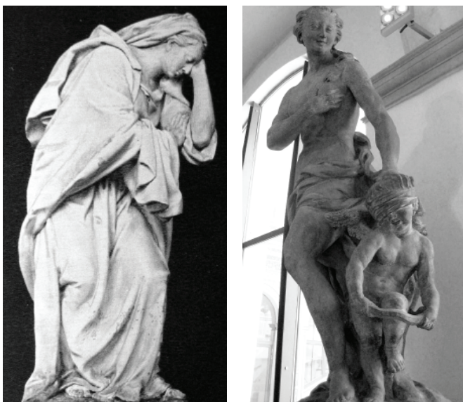
Obr. 5: Ferdinand Maximilián Brokof, Panna Marie Bolestná , 1725, Duchcov, zahradní pavilón. Foto: Oldřich J. Blažíček, Ferdinand Brokof, Praha 1986.