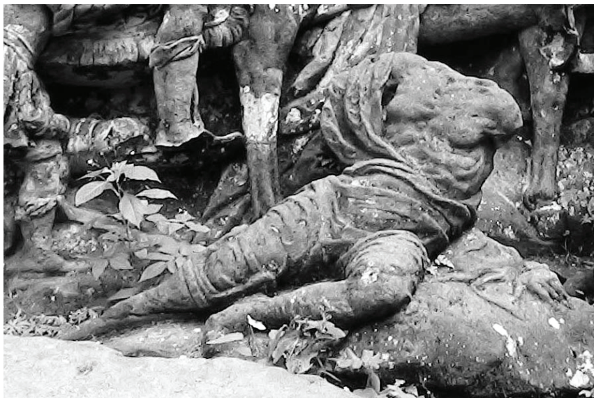
Obr. 19: Matyáš Bernard Braun, Žebrák, Nový les u Kuksu, 1727–1729 a 1731–1732, scéna Narození Páně, Foto: Martin Pavlíček.