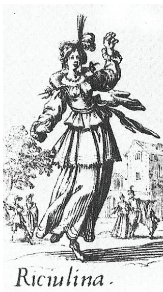
Obr. 15: Matyáš Bernard Braun, Lehkomyšlnost , 1718–1720, Kuks, lapidárium. Obr. 16: Jacques Callot, Riciulina , 1611, z cyklu Balli di Sfessania .