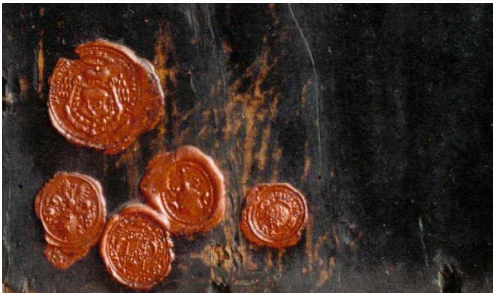
Obr. 3: Chrudimský Kristus, kolem 1600, neznámý malíř, olejomalba na dřevěné desce, Chrudim, kostel Nanebevzetí Panny Marie, zadní strana lipové desky s pečetěmi z 18. století.