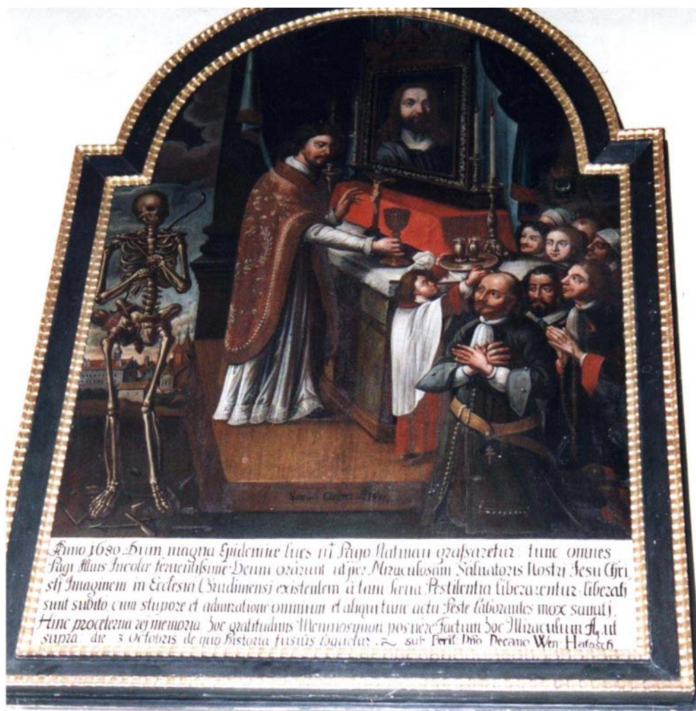
Obr. 8: Votivní obraz Slatiňanských za odvrácení moru prostřednictvím obrazu Chrudimského Krista, 1681, Samuel Andres, olejomalba na dřevěné desce, Chrudim, kostel Nanebevzetí Panny Marie.