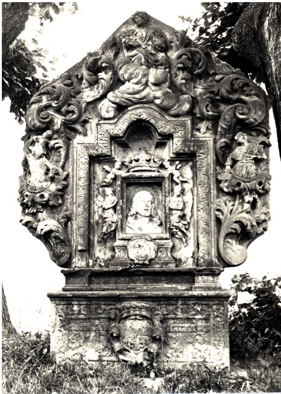
Obr. 9: Salvátorský procesní pískovcový oltář u obce Osenice na Jičínsku, pískovec, neznámý sochař, 1713, celkový pohled.