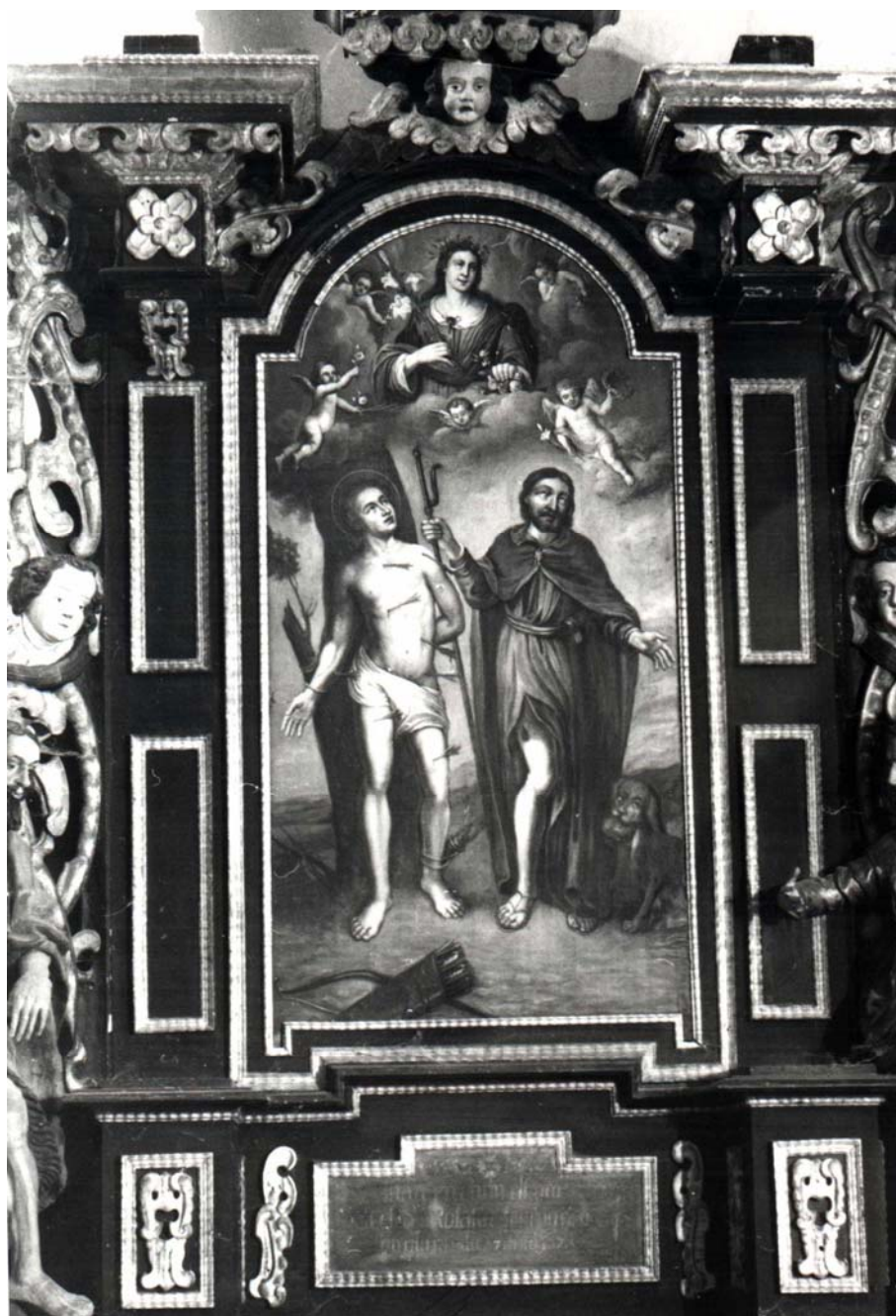
Obr. 6: Oltář protimorových patronů, 1673, Chrudim, kostel sv. Michala, detail středu retabula s ústředním obrazem od malíře Samuela Gindtera a s nápisem o fundaci Samuela Hataše.