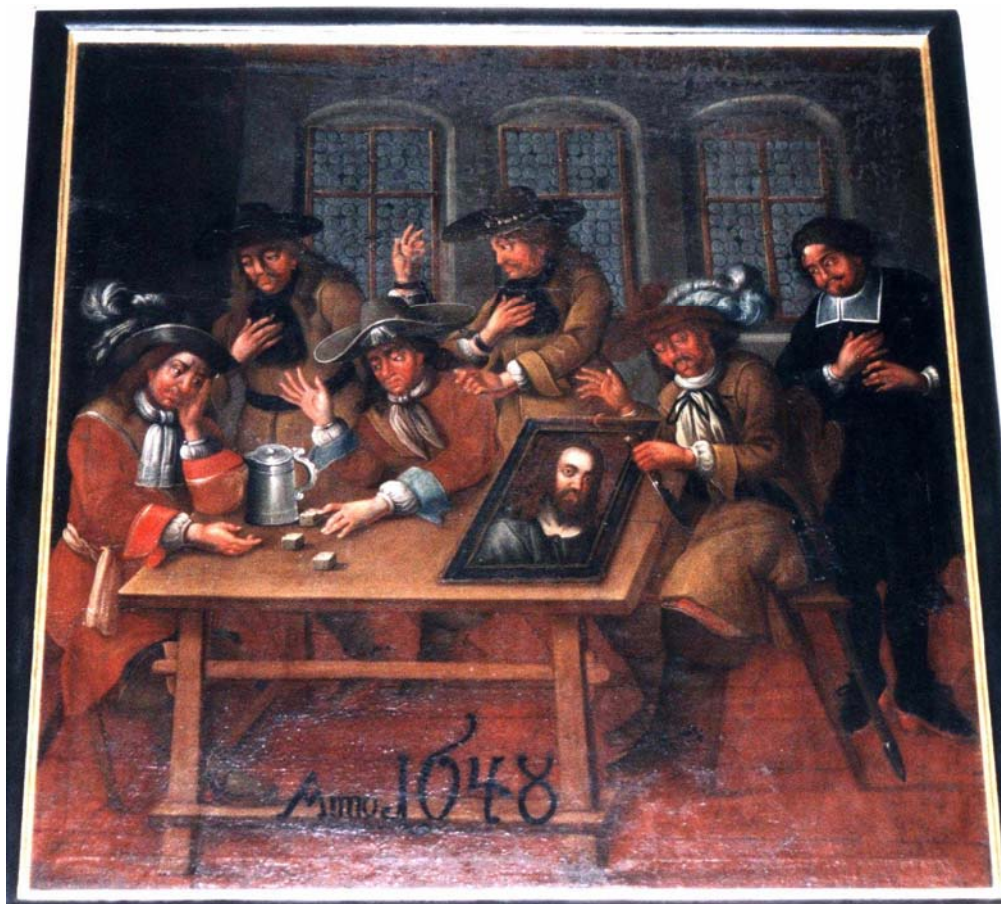
Obr. 7: Tupení obrazu sv. Salvátora švédskými vojáky roku 1648, snad 1680, neznámý malíř (Samuel Andres?), olej na plátně, Chrudim, kostel Nanebevzetí Panny Marie.