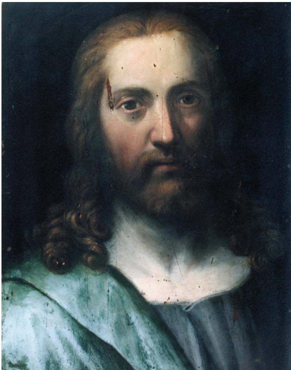
Obr. 1: Chrudimský Kristus, kolem 1600, neznámý malíř, olejomalba na dřevěné desce, Chrudim, kostel Nanebevzetí Panny Marie.