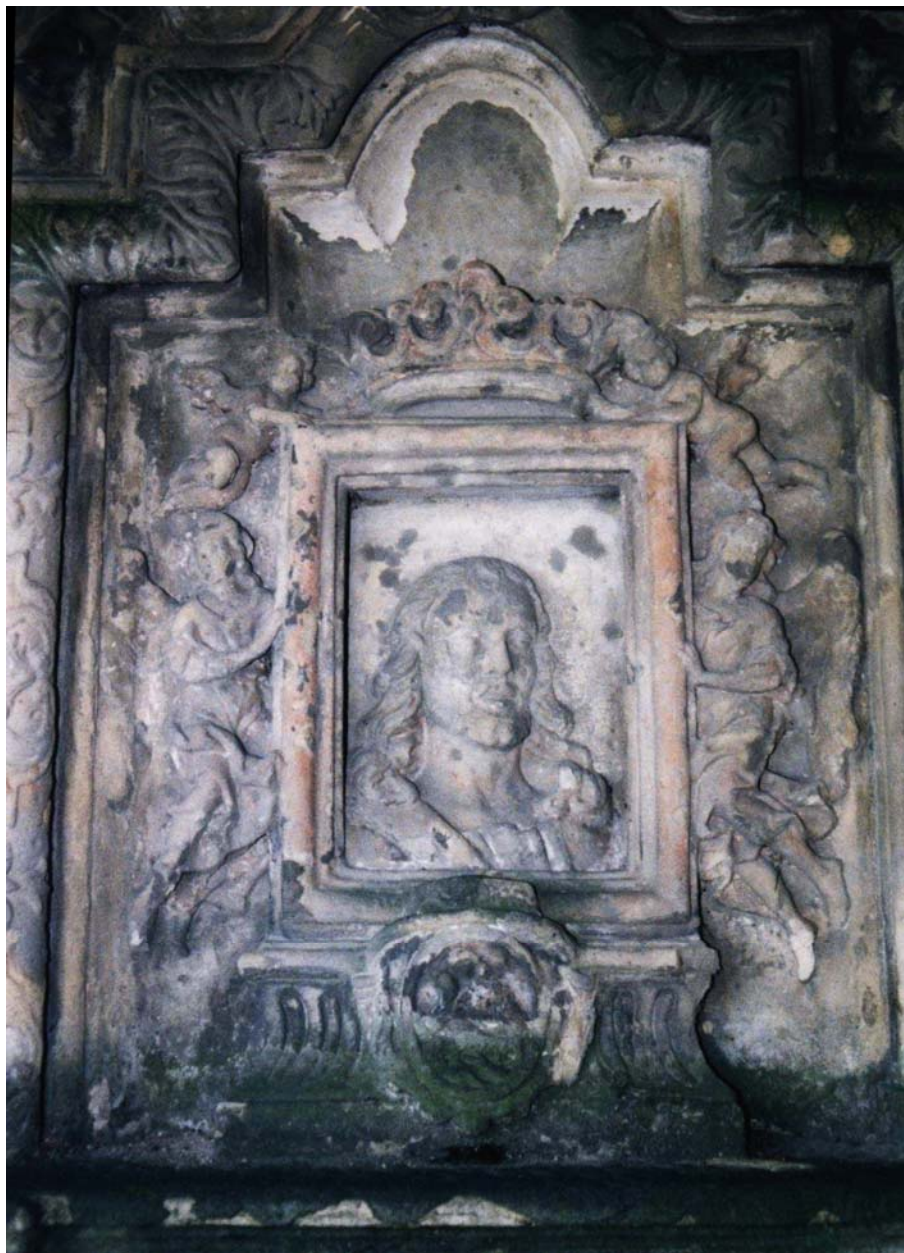
Obr. 10: Salvátorský procesní pískovcový oltář u obce Osenici na Jičínsku, pískovec, neznámý sochař, 1713, detail střední části oltáře s reliéfem zázračného obrazu Chrudimského Krista. Foto Pavel Panoch.