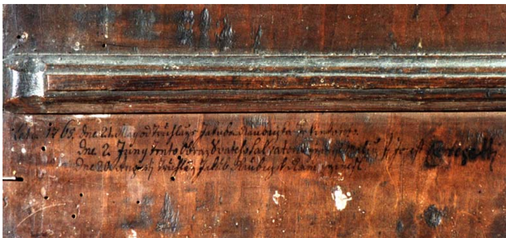
Obr. 11: Kopie obrazu Chrudimského Krista, 1765, Josef Ceregetti, Rtnyně v Podkrkonoší (církevní depozitář), detail nápisu s datací a signaturou chrudimského malíře na zadní straně rámu.