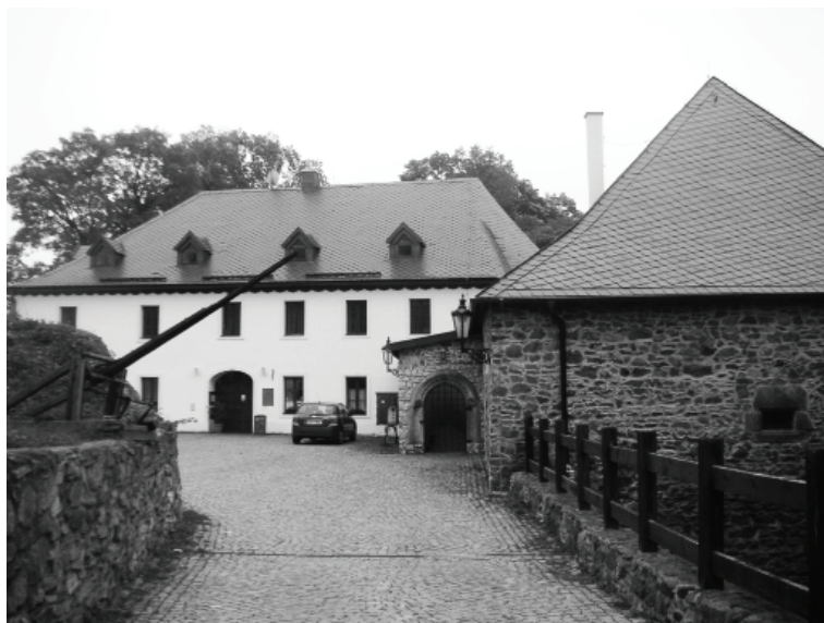
Obr. 3: Bývalý úřednický dům na krupském hradě.