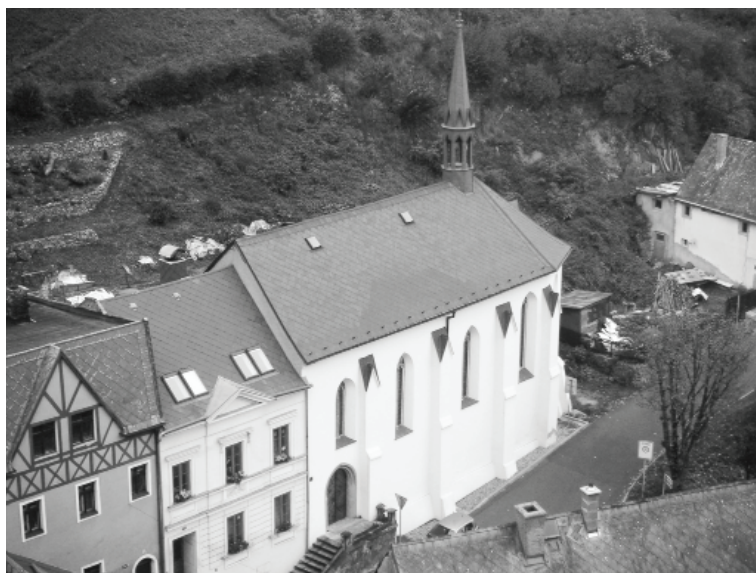
Obr. 2: Špitální kostelík sv. Ducha v Krupce. Foto: Jan Kilián, 2011.