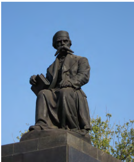
Obr. 1: Spomenik Vuka Karadžića (1787–1864) v Belehrade, park Cyrila a Metoda. (Zdroj: < http://www.panoramio.com/photo/50670006 >.).