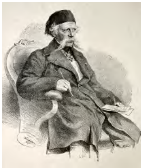
Obr. 2: Vuk Karadžić (v cirilice Вук Стефановић Караџић, 1787–1864), litografija 1865. (Zdroj: < http://www.vreme.com/cms/view.php?id=991480 >.).