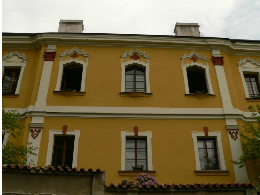
Obr. 5: Litomyšl, Proboštství – detail střední části jižního průčelí.