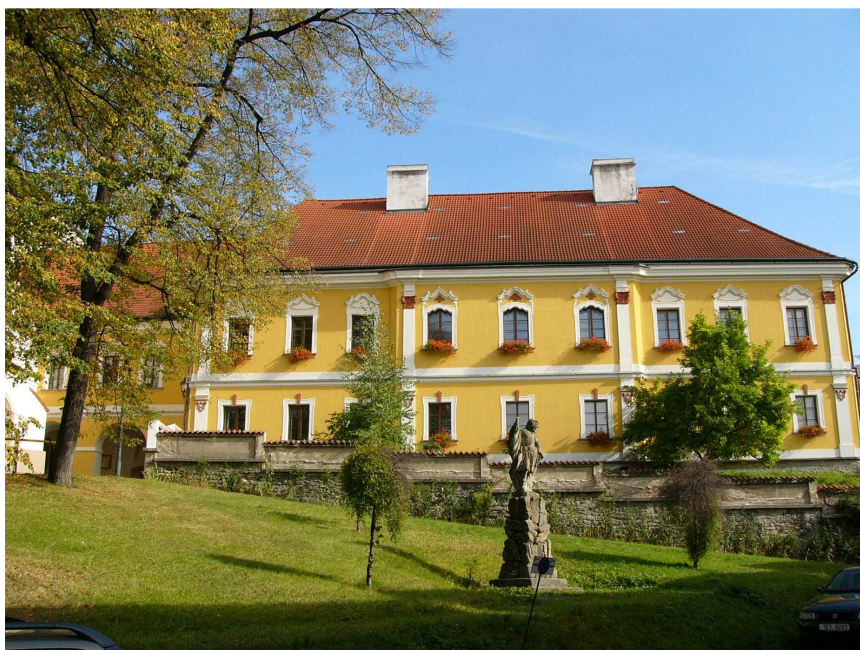
Obr. 4: Litomyšl, Probošství – hlavní jižní průčelí.