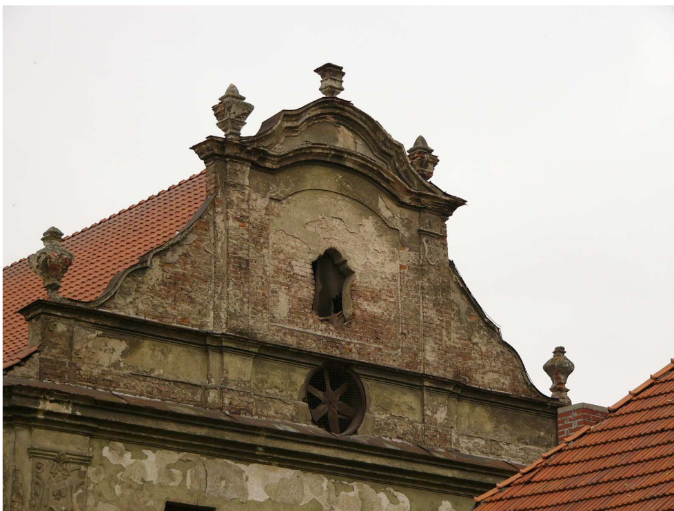
Obr. 10: Litomyšl – Nedošín, Štít sýpky tzv. Pernštejnského dvora.