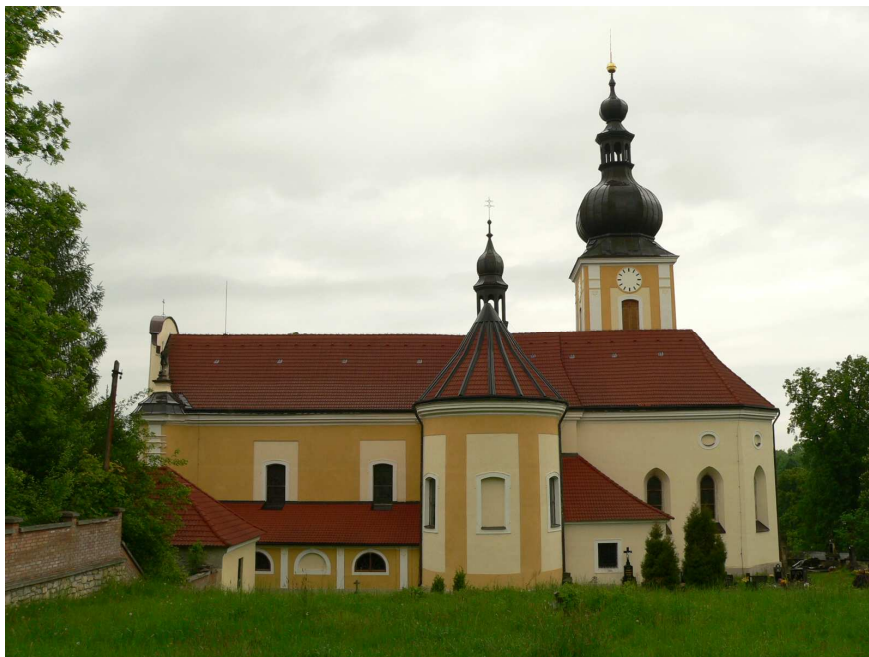
Obr. 6: Čistá, Kostel sv. Mikuláše – pohled z jihu.