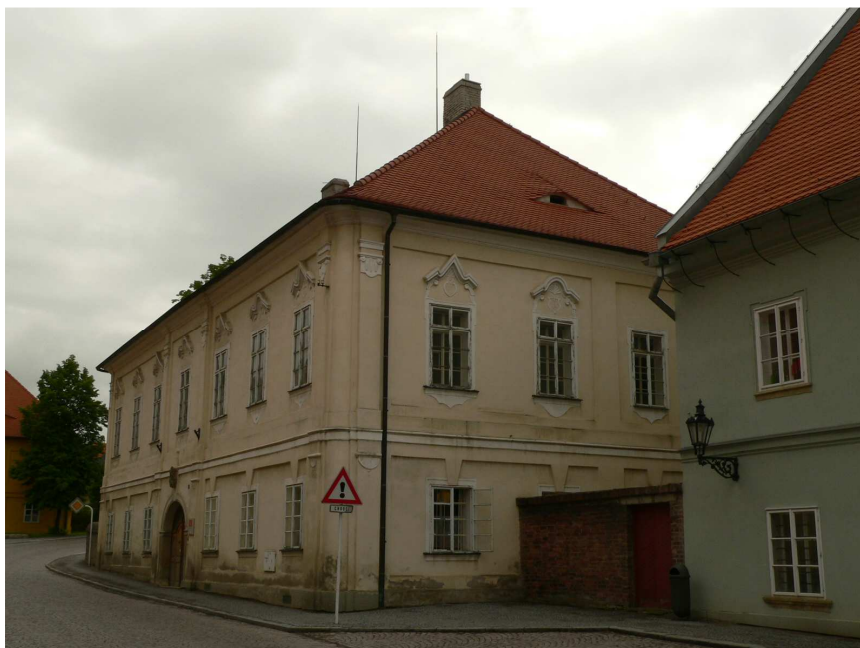
Obr. 3: Litomyšl, Jiráskova ulice č.p. 3, pohled z jihozápadu.