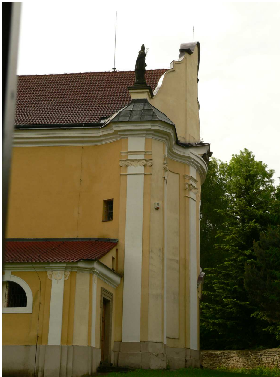
Obr. 7: Čistá, Kostel sv. Mikuláše – detail zvlněného západního průčelí.