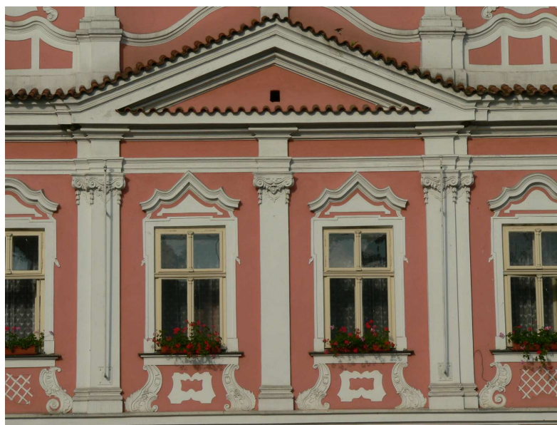
Obr. 2: Litomyšl, Nová radnice č.p. 61 – detail středních os prvního patra.