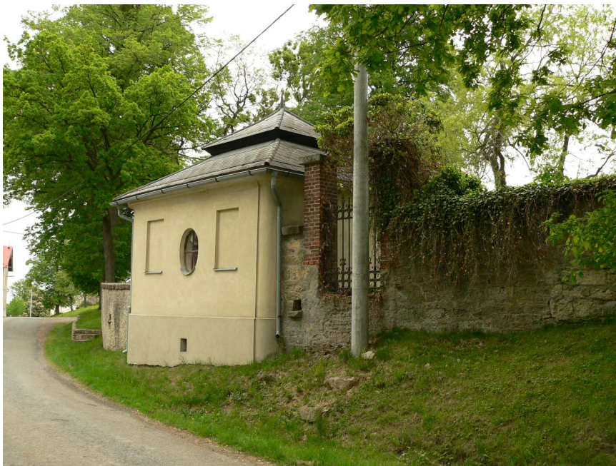
Obr. 9: Květná, Kostnice.