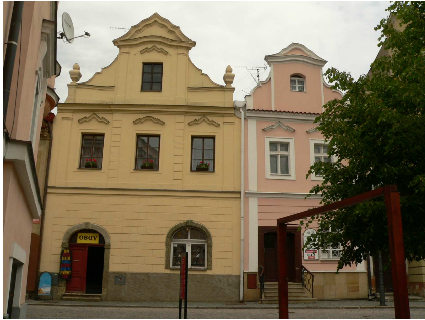
Obr. 8: Litomyšl, Domy č.p. 200 a 201 na Braunerově náměstí.