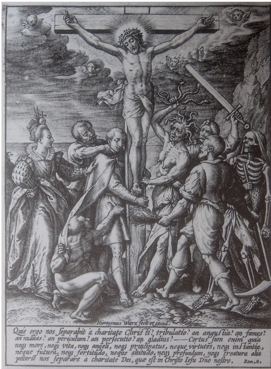
Obr. 3: Hieronymus Wierix, Alegorie lidského spasení , před rokem 1600, rytina.