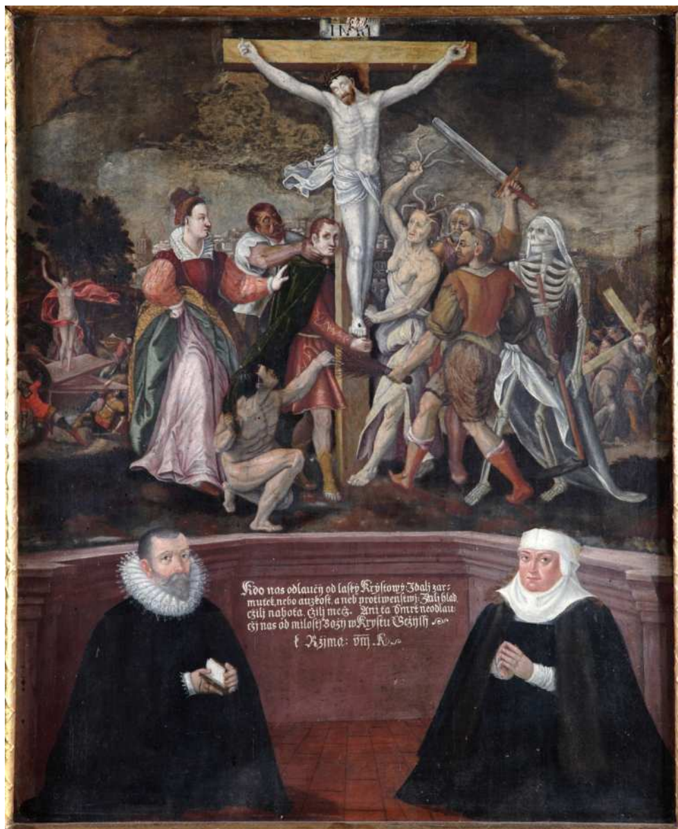
Obr. 2: Matouš Radouš, Epitaf Tomáše Lvíka Domažlického a jeho ženy Salomeny Francové z Liblic s Alegorickým Ukřižováním , po roce 1619, olejová tempera, dřevo, Chrudim, kostel Nanebevzetí Panny Marie, detail ústředního obrazu. Foto: Zdeněk Sodoma.