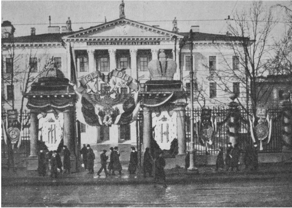
Obr. 3: Výzdoba S.-Petěrburgu během oslav jubilea – budova Státní banky v Sadové ulici. Na bráně vidíme vyobrazení tzv. Monomachovy čapky (vlevo) a carské imperiální koruny (vpravo), mezi nimi dvouhlavý orel – erb Romanovců a současně státní znak Ruska. (Niva, č. 10, 9. 3. 1913, s. 199).

nikoho, byť monarchisté se „návštěvou u cara“ pyšnili, a když kolem nich Mikuláš procházel, dávali svou přítomnost halasně najevo výkřiky „Hurá“ a „Bože, chraň cara“. 62 Carský dvůr tím již po několikáté projevil slabost vůči tlaku ultrapravice a bezpochyby si tím uškodil.