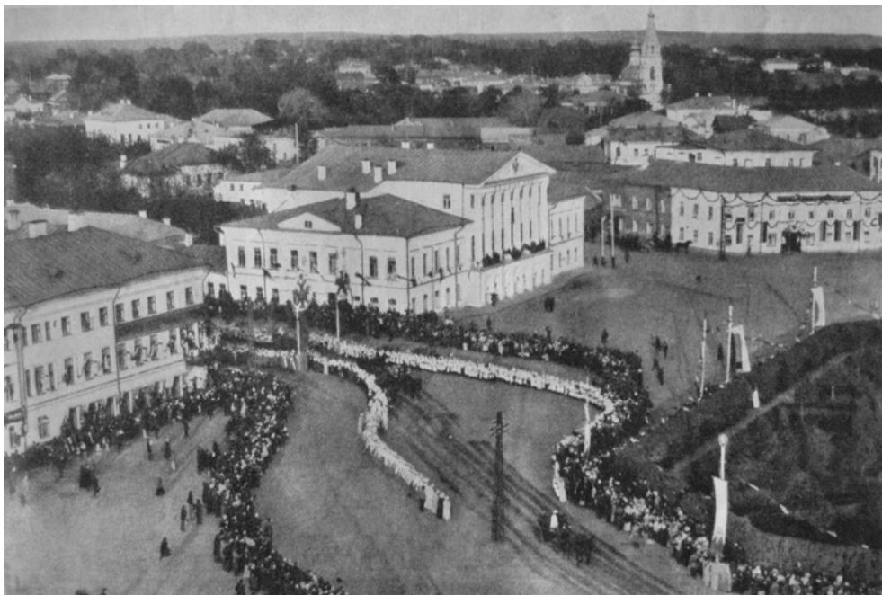
Obr. 10: Příjezd carského průvodu na Susaninovo náměstí v Kostromě (20. května 1913). (Niva, č. 24, 15. 6. 1913, s. 479)

Následující tři dny tvořily jakousi mezihru před všemi očekávanou návštěvou Moskvy, o volnějším tempu však nemohlo být řeči. 21. května se carská rodina nacházela v Jaroslavlí, odtud pokračovala vlakem do Rostova (22. května). V obou městech se odehrály obligátní uvítací rituály a na programu byla především návštěva církevních objektů. V Jaroslavlí na prvním místě Spasského kláštera, kde pobýval Michail Fjodorovič Romanov při cestě z Kostromy do Moskvy. V Rostově si car s dětmi (bez carevny, která se necítila dobře a celý den proležela) se zájmem poslechl zvonkohru v Uspenském chrámu a delší čas strávil v Kremlu. 83 I další program byl poměrně náročný. Dopoledne 23. května carský vlak přijel do stanice Petrovsk. Na nádraží cara uvítali představitelé městské správy, za městem se setkal s delegacemi rolníků. Po krátké prohlídce města pokračovala kolona asi dvaceti automobilů do Pereslavli, vzdálené přibližně padesát verst. Návštěva Pereslavli byla carovi velmi příjemná. Zejména se mu líbilo přijetí šlechtou Vladimirské gubernie. Konalo se v jejím sídle na Pleščejevském jezeře, kde si také prohlédl malé muzeum uchovávající exponáty spojené s Petrem Velikým (např. člun, na kterém se plavil po jezeře). 84