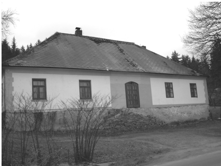
Obr. 3 a 4: Zápis o plánu výdajů na školní výlet (Z kroniky hlinecké školy. SOKA Chru- dim). Bývalá výletní restaurace Veselka dnes.