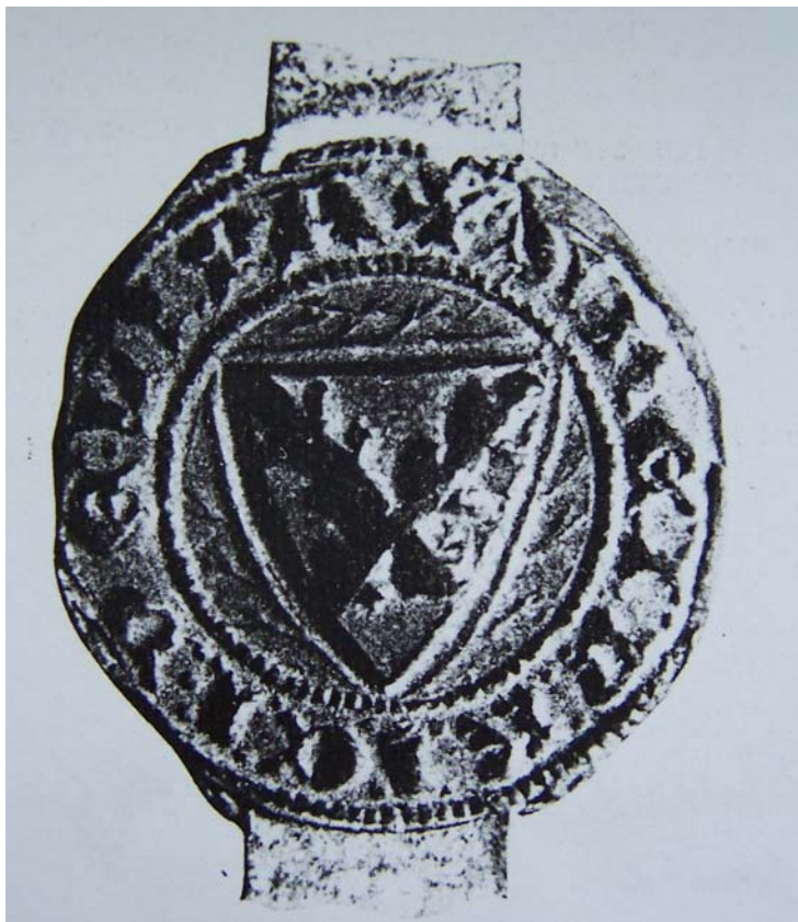
Obr. 18: Pečeť Jindřicha z Lipé, přivěšená k jeho listině z 25. dubna 1316. (František Beneš: Pečetě v Českých zemích.)