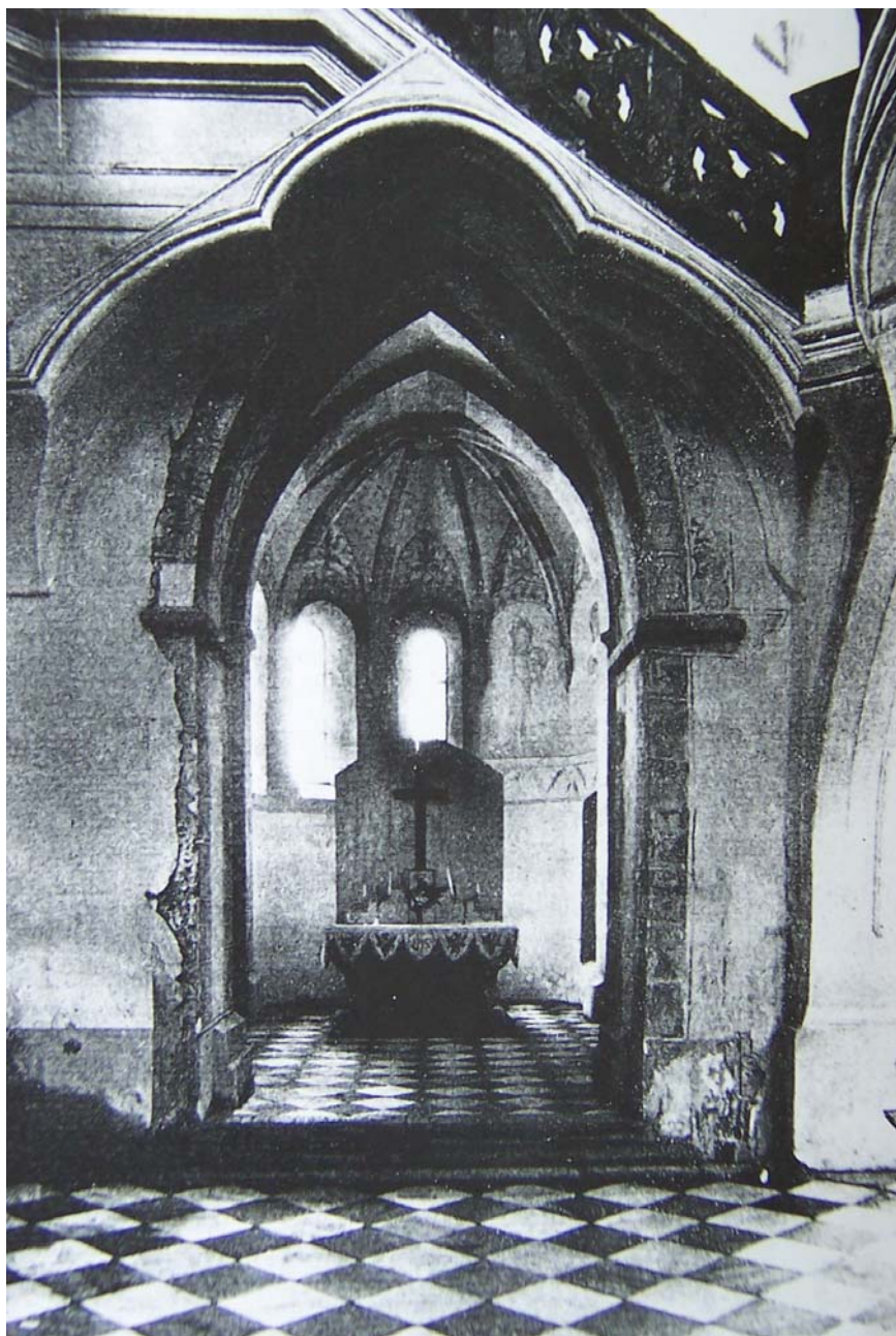
Obr. 5: Žďár nad Sázavou, klášter. Konventní kostel P. Marie a sv. Mikuláše, pohled z boční lodi do severní závěrové kaple. Stav v polovině dvacátého století. (Metoděj Zemek – Antonín Bartůšek: Dějiny Žďáru I.)