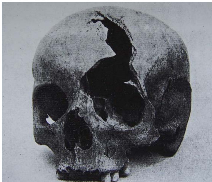
Obr. 16: Žďár nad Sázavou, klášter. Konventní kostel P. Marie a sv. Mikuláše. Jižní závěrová kaple, tumba s pozůstatky členů rodu erbu tří pruhů. Lebka dospělého muže. Tumba byla otevřena v roce 1947.