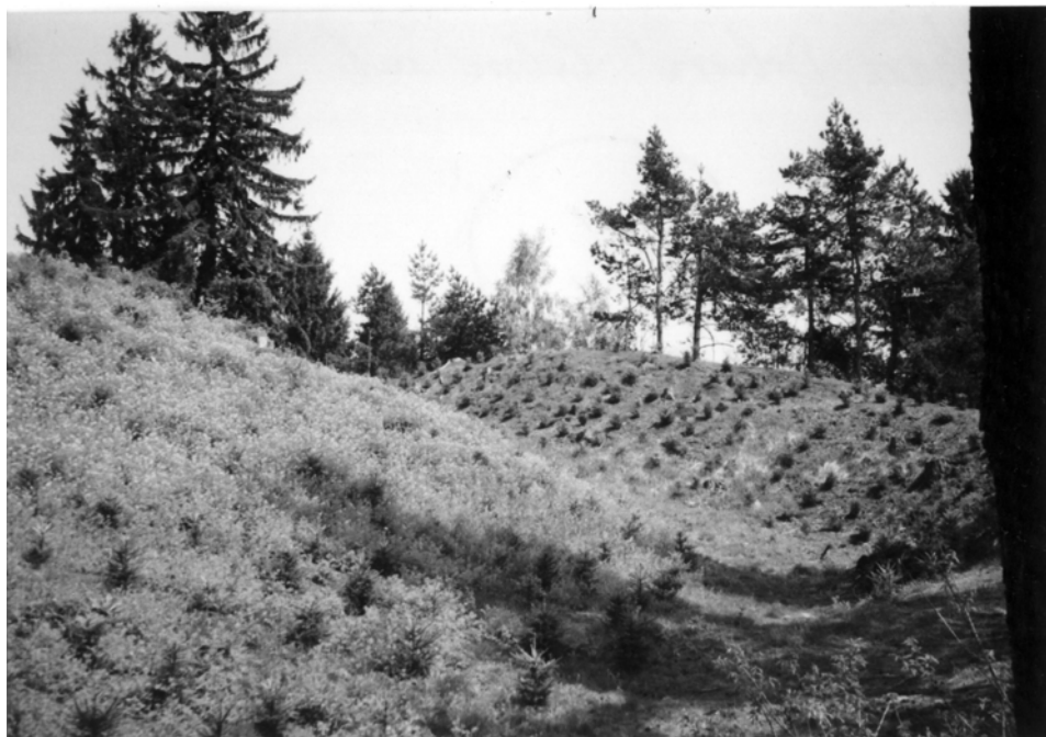
Obr. 14: Hradiště hradu Bobrová. Čelní val. Pohled z vnitřního příkopu směrem k severovýchodu. Současný stav.