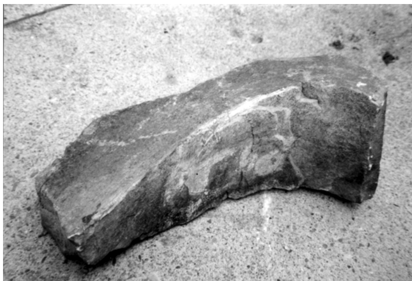
Obr. 15: Hradiště hradu Bobrová. Stavební článek: část do oblouku tesaného ostění.