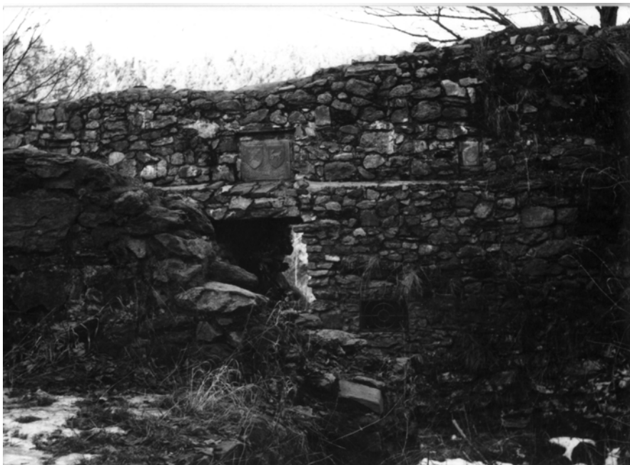
Obr. 10: Hrad Ronovec. Hradní jádro. Současný stav.