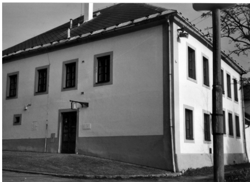
Obr. 17: Nové Město na Moravě. Dům č. 97. Současný stav.