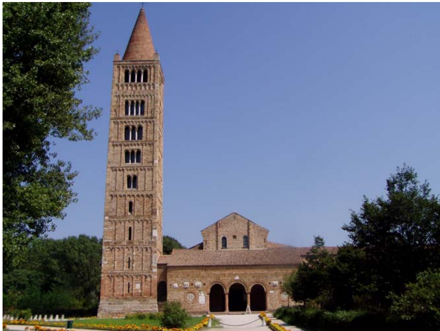
Obrázek 3: Pomposa. Opatství v Pompose.

a přeneseny do Prahy v roce 1039. Později byly tyto ostatky rozdělovány různým kostelům. Lebka sv. Kristýna a ostatky sv. Benedikta, žáka sv. Romualda, našly své místo v Olomouci snad v době dostavby tamního biskupského kostela. 70