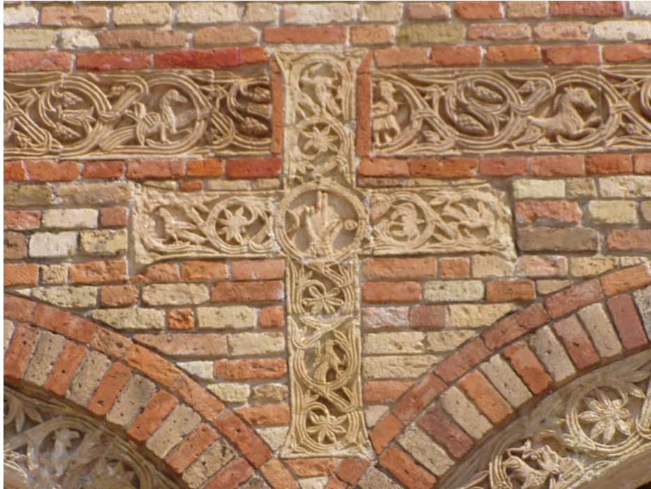
Obrázek 2: Pomposa (detail).

Terakotová výzdoba průčelí klášterního kostela. Materiál i forma přesně odpovídá fragmentům uloženým v Národním muzeu v Ravenně.