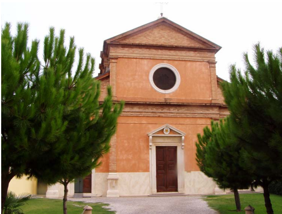
Obrázek 1: Sant Alberto. Dnešní kostel Sant'Alberto (farnost S. Adalberto) ve stejnojmenné obci.

Na jaře roku 1010 se do čela největší z pereonských misí postavil sám Romuald. 56 Již na uherských hranicích však svou skupinu opustil a vrátil se zpět. Dle Petra Damianiho důvodem Romualdova návratu byla nemoc spolu s vysokým věkem. 57 Jeho žáci však pokračovali v cestě. Patnáct jich zůstalo v Uhrách, dva další se měli vydat do Čech. 58 O této dvojici nemáme z jiných pramenů žádné zprávy. Christianizace Čech, alespoň ta oficiální, byla skončena a oblast tak nebyla výslovným misijním územím. Je otázkou, zda-li měl Romuald a jeho skupina dostatek informací o situaci v Čechách. Z pramenů není ani patrný případný návrat dvojice z misijní cesty v Čechách.